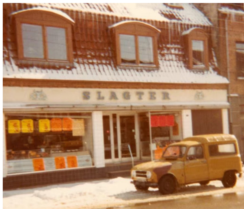
○ Bygningen fotograferet i 1984.