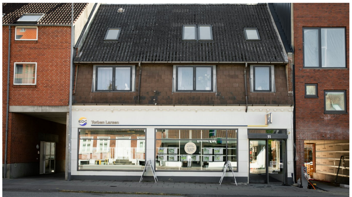
○ I 2026 skyder en ny bygning med lejligheder op hos naboen i nummer 13.